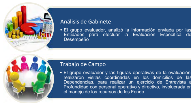
Figura 1. Evaluación de gabinete y de campo