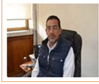
LIC. HUGO LUIS MARTÍNEZ BOUZAS

DIRECTOR GENERAL DEL INSTITUTO DE ESPACIOS EDUCATIVOS DEL ESTADO DE VERACRUZ Y TITULAR DE LA UNIDAD INTERNA DE PROTECCION CIVIL DEL IEEV