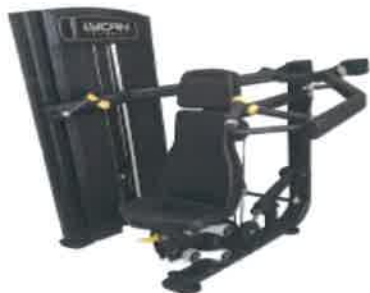
IMAGEN DE ILUSTRATIVA

INCLUYE: CAPACITACION A PERSONAL, CON TECNICOS ESPECIALIZADOS, INSTALACIÓN Y PUESTA EN MARCHA.